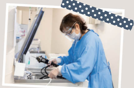
内視鏡検査のサポート 内視鏡検査を受けられる患者さんを支えるのも私たちの役割です。麻酔などの前処置や、脈や血圧などのバイタルチェックを行っています。

患者さんやご家族さんに対して、看護師が入院や手術、検査の説明をしています。わかりやすくお話できるよう心がけておりますが、ご不明な点や、ご不安なことなど、何でもご相談ください。入院された方が退院され、通院に切り替わる際には、入院病棟の看護師より引継ぎも行われています。介護について、富田浜病院グループの介護施設の職員を交えた相談もできます。診察だけでなく、ご不安の相談窓口という気持ちでおりますので、ぜひ何でもおっしゃってください。