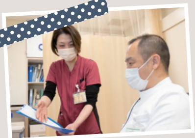
診察がスムーズに進む補助 外来受診時に、医師の診察が受けやすいようサポートしています。疑問点や不安など、看護師がお答えできる範囲になりますが、何でもおっしゃってください。

富田浜病院には多様な診療科がありますが、その外来の診察に立ち会っているのが外来看護師です。主な役割は、患者さんが医師の診察や検査をスムーズに受けられるようサポートすること。処置室で、採血や点滴などを行うのも私たちの役割です。初診の方はとくに不安を抱えているため細かな気配りを心がけており、再診の方は前回の診察を踏まえ、医療従事者として注意を払いながらお声がけしています。