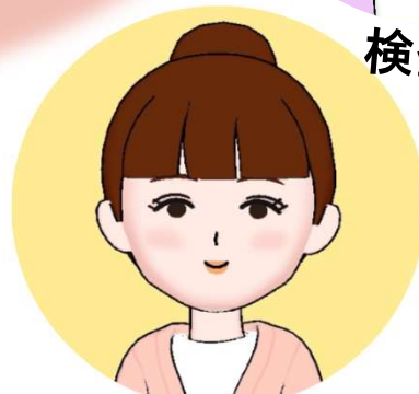
看護師 フットケア指導士