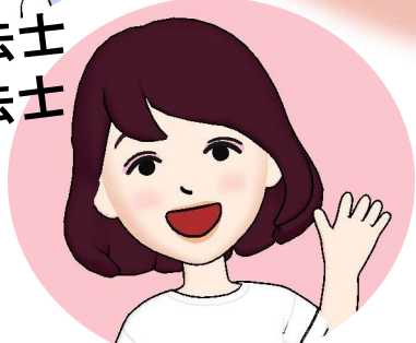
糖尿病療養指導士 管理栄養士